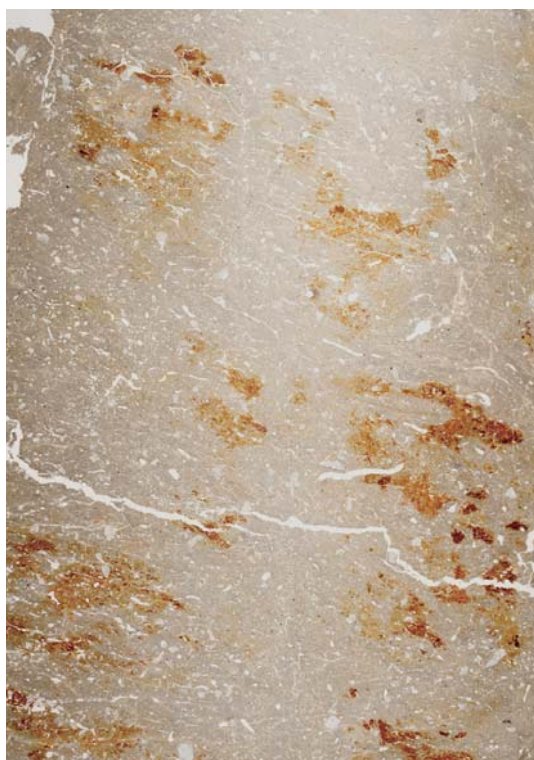
図1. 疑似グライ層薄片(幅70mm)