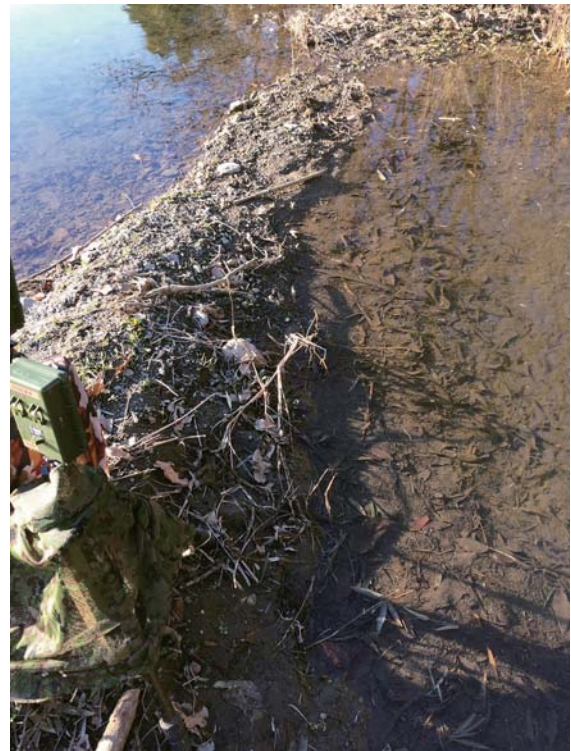
写真2：高麗川本流(左)と城西ワンド(右)と トレイルカメラ 水量によっては本流から完全に分離されるワンド (2017年1月11日撮影)