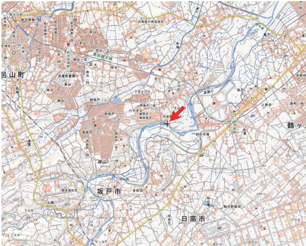
図 1 : 高麗川の多和田橋下流の城西ワンド(赤矢印)の地理的情報(国土地理院地理院地図改変)