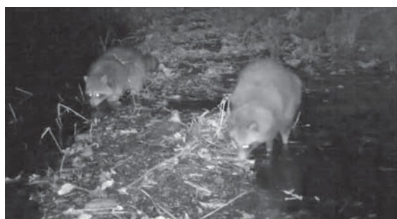
写真9 : 城西ワンドのタヌキ(右)とアライグマ(左) (2016年11月26日 17 : 49 記録)