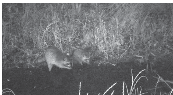
写真7 : 城西ワンドで餌を探すアライグマ (2017年6月30日 2 : 52 記録)