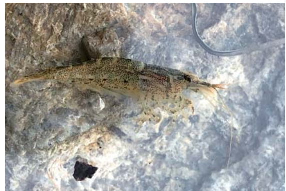
写真4：城西ワンド内で捕獲したミナミヌマエビと シナヌマエビの交雑種