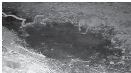
写真8 : 城西ワンドに閉じ込められた魚を捕食するタヌキ (2017年1月8日 22 : 46 撮影)