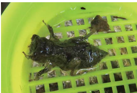
写真5：城西ワンド内で捕獲したヤゴ