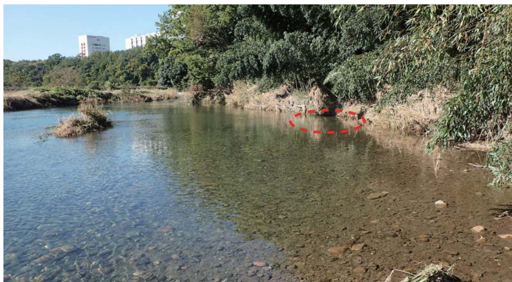
写真6 : 2017年秋の大雨の後、高麗川本流とワンドの区別がなくなった 点線が城西ワンドのあった箇所 (2017年11月3日撮影)