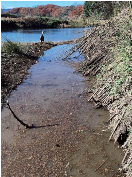
写真1：高麗川本流(奥)と城西ワンド(手前)と トレイルカメラ 写真上部に多和田橋が見える(2016年12月9日撮影)