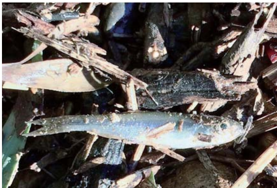
写真3：城西ワンド内で捕獲したカワムツの幼魚