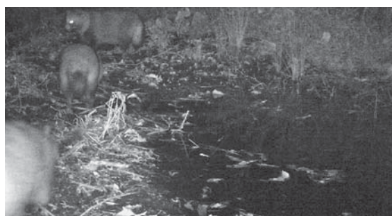
写真11 : 城西ワンドの3頭のタヌキ (2016年11月23日 0 : 12 記録)