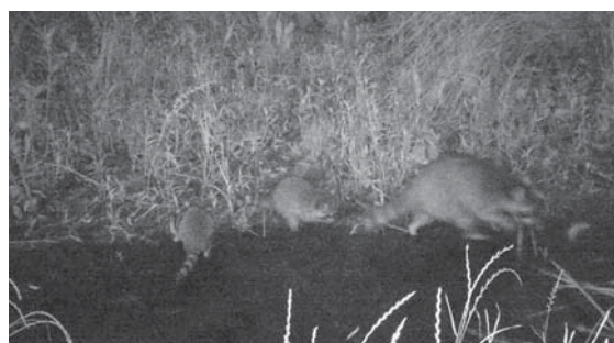
写真10 : 城西ワンドのアライグマ親子 (2017年7月1日 3 : 54 記録)