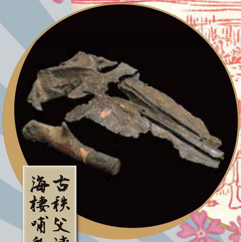
古秩父湾 海棲哺乳類化石群